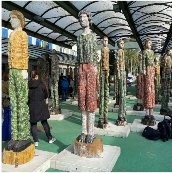
Wächter am Zoll

Quartierverein Bodan in Kreuzlingen _ 5. Mai 2022 _ PROTOKOLL